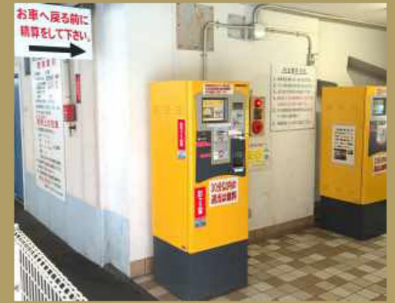
エレベーター前精算機