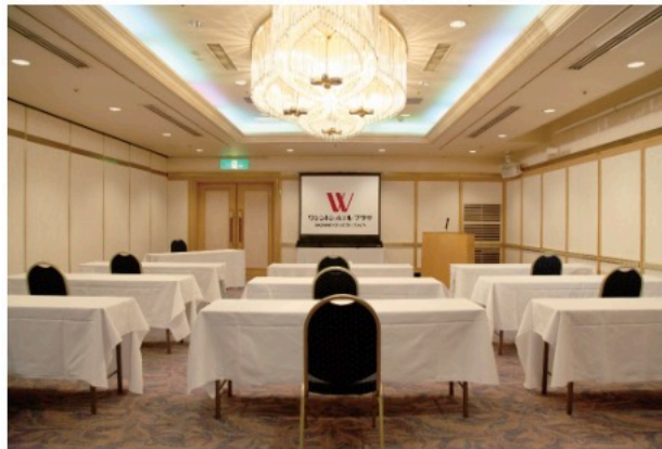
中部屋(スクール形式配置例)